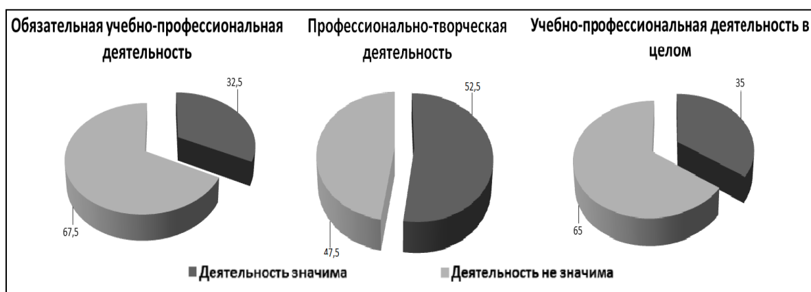
Рис. 1. Соотношение значимости учебно-профессиональной деятельности среди студентов первого курса

В начале профессионализации, целью которой является освоение профессии психолога, наиболее значимой для студентов является профессионально-творческая деятельность – 52,5% респондентов оценивают данный тип деятельности как значимый. Соответственно обязательная учебно-профессиональная деятельность для первокурсников менее значима – 32,5% респондентов оценивают данный тип деятельности как значимый, что свидетельствует о некотором дисбалансе двух разновидностей деятельности, целью которых является успешное освоение профессии, что, в свою очередь, приводит к тому, что учебно-профессиональная деятельность для большинства первокурсников не является ведущей деятельностью. Это говорит о том, что 65% первокурсников хотели бы тратить на учебно-профессиональную деятельность меньше времени, чем тратят на неё в реальных условиях. Соотношение значимости учебно-профессиональной деятельности для студентов первого курса отражено на рисунке 1.